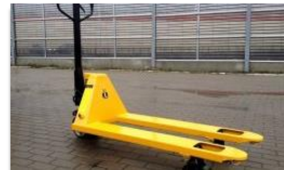
Wózek widłowy ręczny